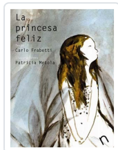
LA PRINCESA FELIZ FRABETTI, CARLO