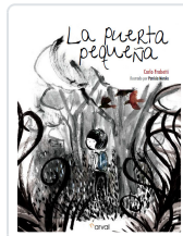
LA PUERTA PEQUEÑA FRABETTI, CARLO