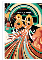
LA VUELTA AL MUNDO EN 80 ENIGMAS FRABETTI, CARLO