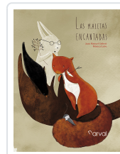
LAS MALETAS ENCANTADAS GISBERT, JOAN MANUEL