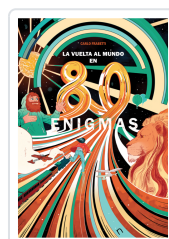
LA VUELTA AL MUNDO EN 80 ENIGMAS FRABETTI, CARLO