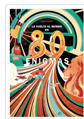
LA VUELTA AL MUNDO EN 80 ENIGMAS FRABETTI, CARLO