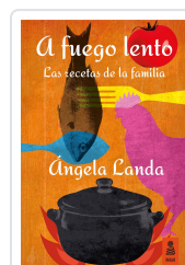
A FUEGO LENTO LANDA APARICIO, ÁNGELA