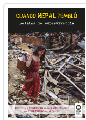
CUANDO NEPAL TEMBLÓ VARIOS AUTORES