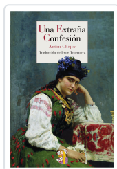
UNA EXTRAÑA CONFESIÓN CHÉJOV, ANTON