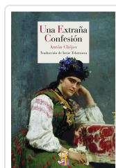
UNA EXTRAÑA CONFESIÓN CHÉJOV, ANTÓN