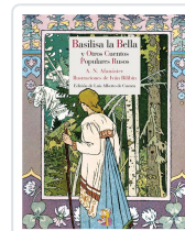
BASILISA LA BELLA Y OTROS CUENTOS POPULARES RUSOS AFANÁSIEV, ALEKSANDR NIKOLÁYEVICH