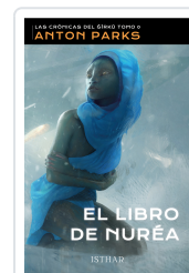
EL LIBRO DE NURÉA PARKS, ANTON