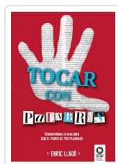
TOCAR CON PALABRAS LLADO MICHELÍ, ENRIC