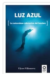
LUZ AZUL VILLANUEVA TOMAS, ULYSES