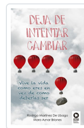
DEJA DE INTENTAR CAMBIAR MARTÍNEZ DE UBAGO, RODRIGO; AZNAR BRIONES, MARA