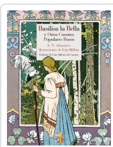
BASILISA LA BELLA Y OTROS CUENTOS POPULARES RUSOS AFANÁSIEV, ALEKSÁNDR NIKOLÁYEVICH