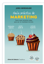
GUÍA PRÁCTICA DE MARKETING BERENGUER VALL-LLOBERA, JORDI