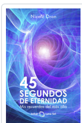
45 SEGUNDOS DE ETERNIDAD DRON, NICOLE