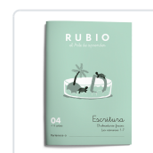
ESCRITURA RUBIO 04 RUBIO SILVESTRE, RAMÓN