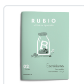
ESCRITURA RUBIO 02 RUBIO SILVESTRE, RAMÓN