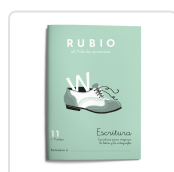
ESCRITURA RUBIO 11 RUBIO SILVESTRE, RAMÓN