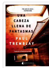
UNA CABEZA LLENA DE FANTASMAS TREMBLAY, PAUL