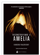
RECONSTRUYENDO A AMELIA MCCREIGHT, KIMBERLY