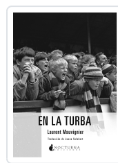
EN LA TURBA MAUVIGNIER, LAURENT