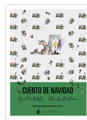
CUENTO DE NAVIDAD DICKENS, CHARLES