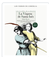
LA VÍSPERA DE SANTA INÉS KEATS, JOHN