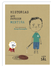
HISTORIAS QUE PARECEN MENTIRA GYEONGSU, KANG