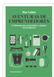
AVENTURAS DE EMPRENDEDORES GALTÉS CAMPS, MAR