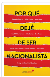
POR QUÉ DEJÉ DE SER NACIONALISTA AA.VV