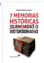
SIETE MEMORIAS HISTÓRICAS SILENCIADAS O DISTORSIONADAS RAMÓN ROSAL