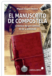
EL MANUSCRITO DE COMPOSTELA MIGUEL ÁNGEL VELASCO