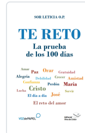
TE RETO. LA PRUEBA DE LOS 100 DÍAS AA.VV.