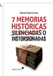
SIETE MEMORIAS HISTÓRICAS SILENCIADAS O DISTORSIONADAS RAMÓN ROSAL