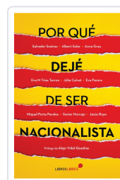
POR QUÉ DEJÉ DE SER NACIONALISTA AA.VV.