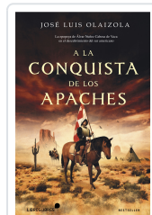
A LA CONQUISTA DE LOS APACHES JOSE LUIS OLAIZOLA