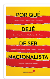
POR QUÉ DEJÉ DE SER NACIONALISTA AA.VV.