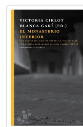
EL MONASTERIO INTERIOR CIRLOT VALENZUELA, VICTORIA; GARÍ AGUILERA, BLANCA; RAININI, MARCO; TAUSIET CARLES, CARLES; BRUZELIUS, CA