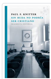
SIN BUDA NO PODRÍA SER CRISTIANO KNITTER, PAUL F.