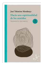
HACIA UNA ESPIRITUALIDAD DE LOS SENTIDOS TOLENTINO MENDONÇA, JOSÉ