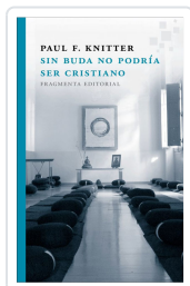
SIN BUDA NO PODRÍA SER CRISTIANO KNITTER, PAUL F.