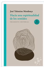
HACIA UNA ESPIRITUALIDAD DE LOS SENTIDOS TOLENTINO MENDONÇA, JOSÉ