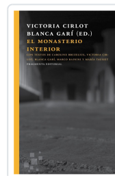
EL MONASTERIO INTERIOR CIRLOT VALENZUELA, VICTORIA; GARI AGUILERA, BLANCA; RAININI, MARCO; TAUSIET CARLÉS, MARÍA; BRUZELIUS, CA