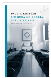
SIN BUDA NO PODRÍA SER CRISTIANO KNITTER, PAUL F.