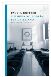
SIN BUDA NO PODRÍA SER CRISTIANO KNITTER, PAUL F.