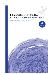
EL CEREBRO ESPIRITUAL RUBIA, FRANCISCO