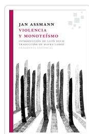
VIOLENCIA Y MONOTEÍSMO ASSMANN, JAN