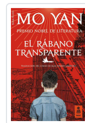
EL RÁBANO TRANSPARENTE YAN, MO