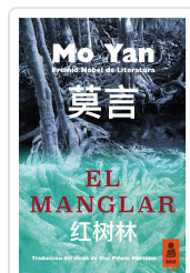
EL MANGLAR YAN, MO