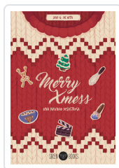
MERRY XMESS: UNA NAVIDAD DESASTROSA G. DE HITA, JAVI