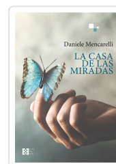
LA CASA DE LAS MIRADAS DANIELE MENCARELLI