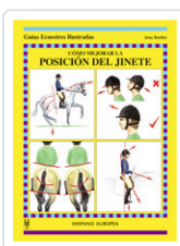
CÓMO MEJORAR LA POSICIÓN DEL JINETE BENTLEY, JONY