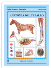
ANATOMÍA DEL CABALLO COLLES, CHRIS