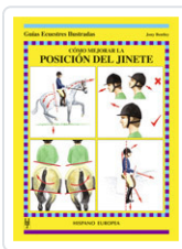
CÓMO MEJORAR LA POSICIÓN DEL JINETE BENTLEY, JONNY