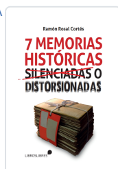
SIETE MEMORIAS HISTÓRICAS SILENCIADAS O DISTORSIONADAS RAMÓN ROSAL