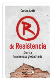
R DE RESISTENCIA CARLOS ASTIZ