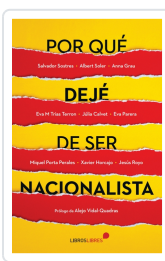
POR QUÉ DEJÉ DE SER NACIONALISTA AA.VV