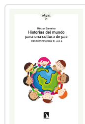
HISTORIAS DEL MUNDO PARA UNA CULTURA DE PAZ BARREIRO, HÉCTOR