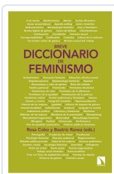
BREVE DICCIONARIO DE FEMINISMO COBO BEDIA, ROSA / RANEA TRIVIÑO, BEATRIZ