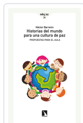
HISTORIAS DEL MUNDO PARA UNA CULTURA DE PAZ BARREIRO, HÉCTOR