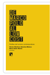
DE MARCO POLO AL LOW COST MARTÍNEZ SÁNCHEZ- MATEOS, HÉCTOR/RUBIO MARTÍN, MARÍA