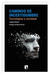
CAMINOS DE INCERTIDUMBRE PRADA, ALBINO