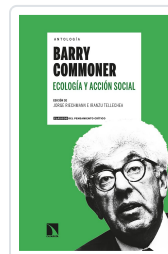
ANTOLOGÍA BARRY COMMONER ECOLOGÍA Y ACCIÓN SOCIAL EDICIÓN DE RIECHMANN, JORGE/TELLECHEA, IRANZU