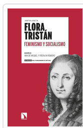
FEMINISMO Y SOCIALISMO TRISTÁN, FLORA