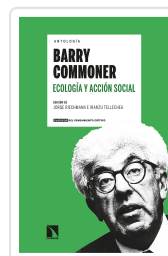
ANTOLOGÍA BARRY COMMONER ECOLOGÍA Y ACCIÓN SOCIAL RIECHMANN, JORGE/TELLECHEA, IRANZU