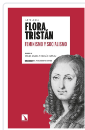
ANTOLOGÍA FLORA TRISTÁN FEMINISMO Y SOCIALISMO EDICIÓN DE TRISTÁN, FLORA