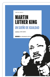
ANTOLOGÍA MARTIN LUTHER KING. UN SUEÑO DE IGUALDAD GOMIS, JOAN / DEL BUEY CAÑAS, RAMÓN