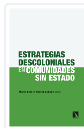
ESTRATEGIAS DESCOLONIALES EN COMUNIDADES SIN ESTADO LOIS, MARÍA / AKKAYA, AHMET