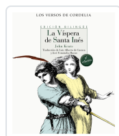
LA VÍSPERA DE SANTA INÉS KEATS, JOHN