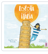
LOLOTA VIAJA A ITALIA FERNÁNDEZ FERMOELLE, ÁNGEL