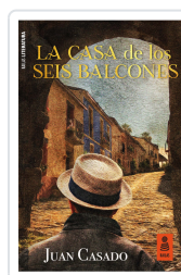
LA CASA DE LOS SEIS BALCONES CASADO FLORES, JUAN