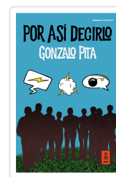
POR ASÍ DECIRLO PITA, GONZALO