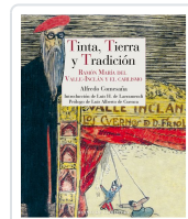
TINTA, TIERRA Y TRADICIÓN COMESAÑA PAZ, ALFREDO