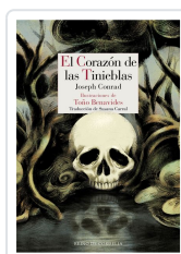
EL CORAZÓN DE LAS TINIEBLAS CONRAD, JOSEPH