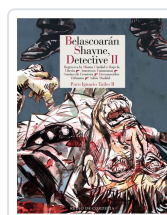
BELASCOARÁN SHAYNE, DETECTIVE II TAIBO II, PACO IGNACIO