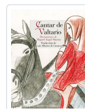
CANTAR DE VALTARIO ANÓNIMO