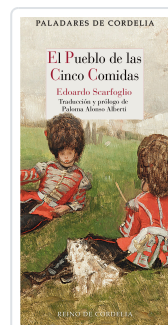
EL PUEBLO DE LAS CINCO COMIDAS SCARFOGLIO, EDOARDO