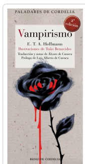
VAMPIRISMO HOFFMANN, E. T. A. [ERNEST THEODOR AMADEUS]