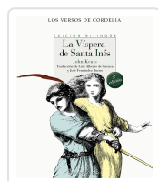
LA VÍSPERA DE SANTA INÉS KEATS, JOHN