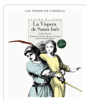
LA VÍSPERA DE SANTA INÉS KEATS, JOHN