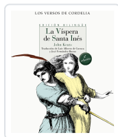
LA VÍSPERA DE SANTA INÉS KEATS, JOHN