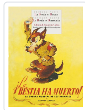
¡LA BESTIA HA MUERTO!