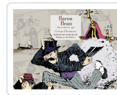
BARÓN BEAN GEORGE HERRIMAN