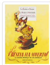
¡LA BESTIA HA MUERTO!